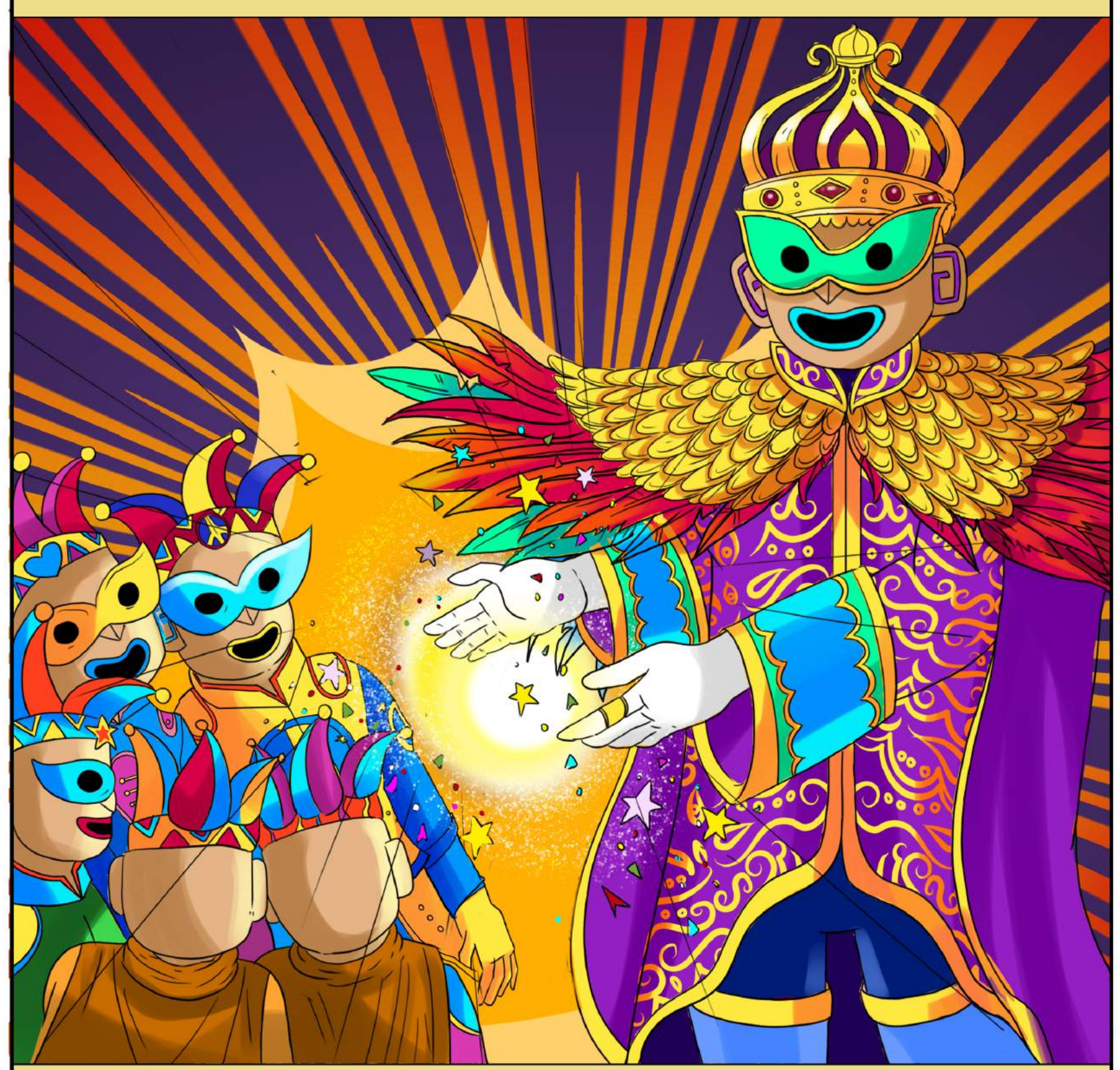
EL REY MOMO, POR SIGLOS HA SIDO EL GUARDIÁN DEL CARNAVAL, ES QUIEN PRESIDE LAS FIESTAS Y A QUIEN, EN ESOS DÍAS, RENDIMOS PLEITESÍA. ES EN HONOR A ÉL QUE CELEBRAMOS ESTA TRADICIÓN EN LA QUE POR ALGUNOS DÍAS SE ROMPEN LOS ESTEREOTIPOS, LAS CLASES SOCIALES, DONDE PODEMOS BURLARNOS DE NOSOTROS MISMOS Y DIVERTIRNOS SIN PARAR. MOMO TIENE LA CARACTERÍSTICA DE SER EL ÚNICO PERSONAJE EN POSEER LOS 5 PODERES MÁGICOS Y HA DECIDIDO DOTAR DE UNO DE ESTOS A CADA TRIBU MOMOE.

NACEN COMO UNA DINASTÍA PARA SALVAGUARDAR LA EXISTENCIA DE ESTA CELEBRACIÓN Y SE HAN ESTABLECIDO EN CIUDAD CARNAVAL DESDE DONDE SIRVEN AL REY MOMO QUIEN LES HA ENCOMENDADO UNIR FUERZAS PARA LOGRAR QUE EL CARNAVAL VUELVA A RESURGIR MÁS FUERTE QUE NUNCA ESPARCIENDO EL ESPÍRITU CARNAVALERO DOTÁNDOLOS DE PODERES MÁGICOS CON LOS CUALES PODRÁN CUMPLIR LA IMPORTANTE TAREA, REGRESAR EL COLOR, LA FANTASÍA Y LA ALGARABÍA A TODOS LOS RINCONES DE MÉRIDA.